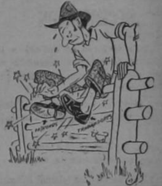
¡Cómo me "aprietan" estos benditos zapatos!