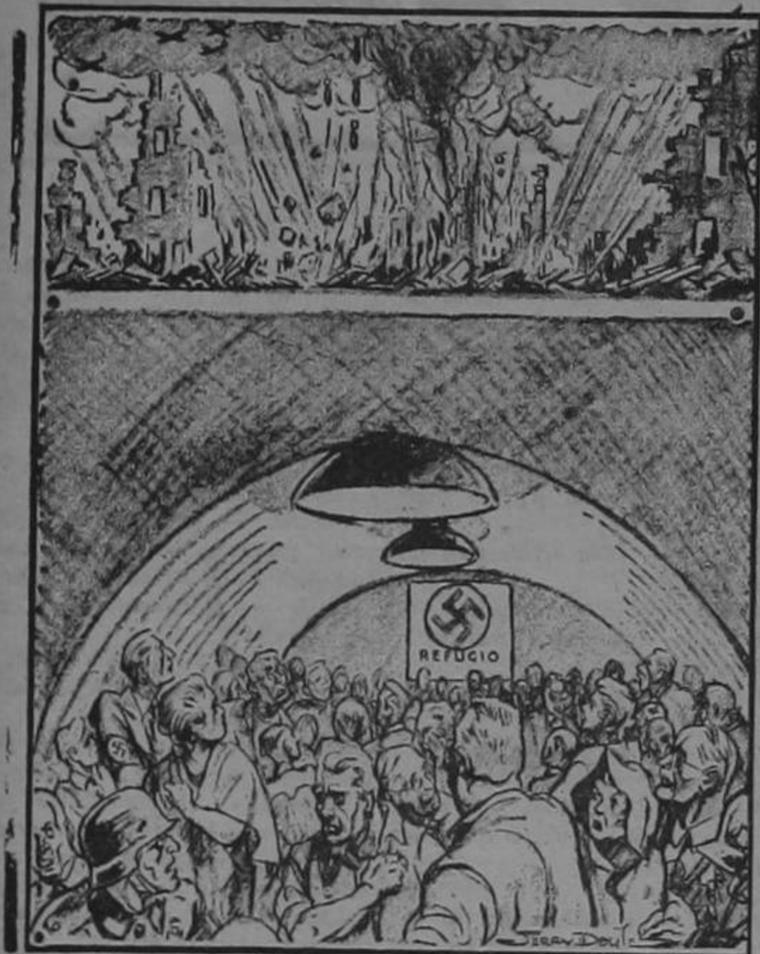
ADOLFO LES PROMETIO "ESPACIO VITAL"