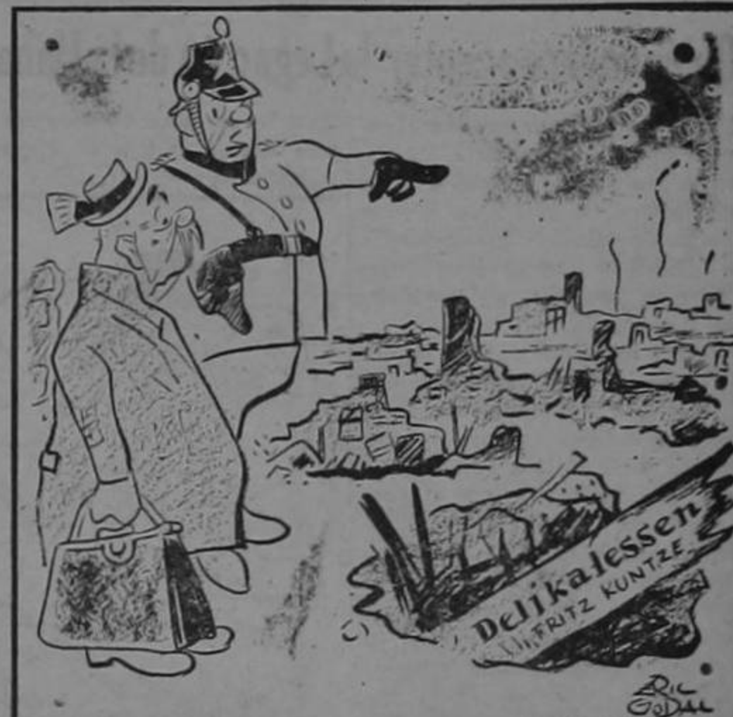
"La tienda de comestibles? Ande Vd. dos cuadras y tuerza a la derecha cuando llegue a lo que era antes el Ministerio del Aire..."