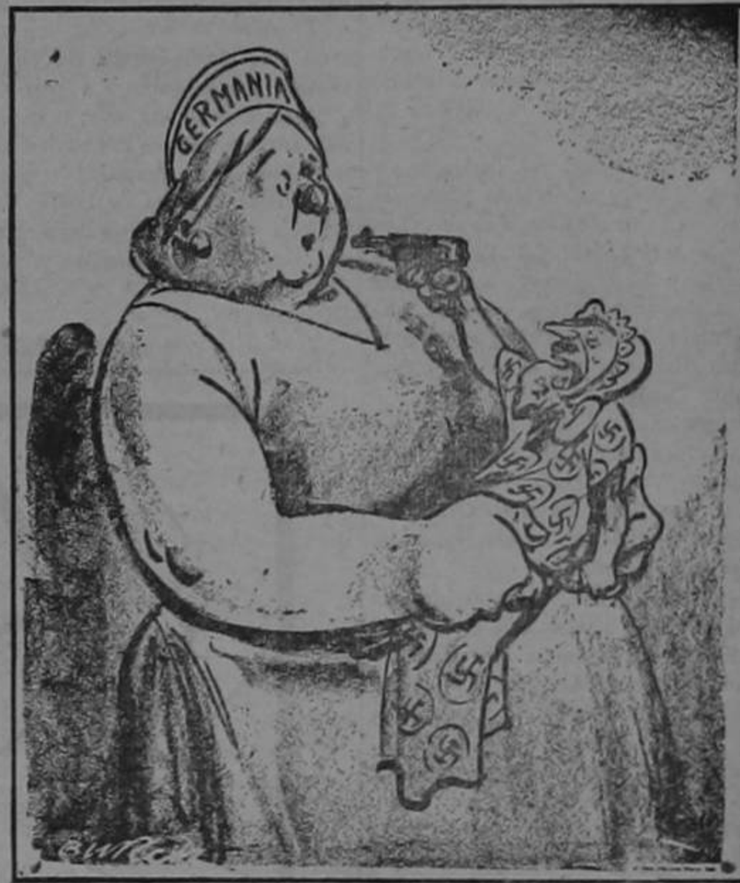
"Como me dejes caer...!"

—Mayores aprietos pasará el que no quiera que vista bien.