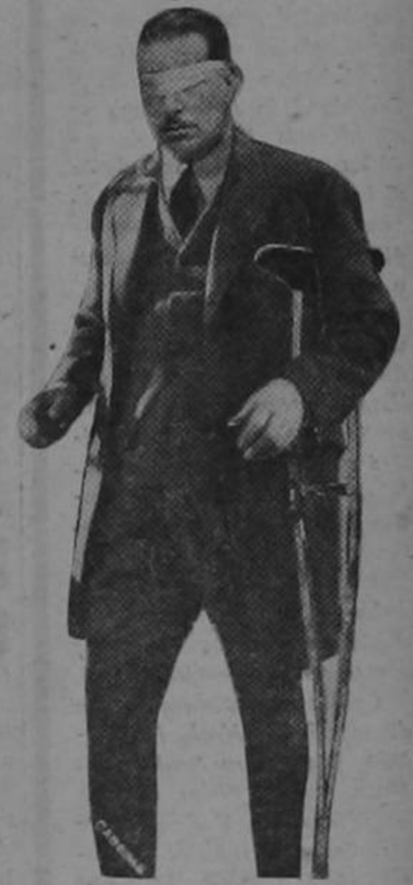
Don Teodoro, don Teodoro, ya no puede caminar... porque le falta, porque le falta, buen tacto para gobernar...

Los dos sectores de la opinión pública, más encontrados entre sí, dicen en todos los tonos que el señor Presidente de la República no se da cuenta de la realidad del momento. En concreto, que don Teodoro está a oscuras.