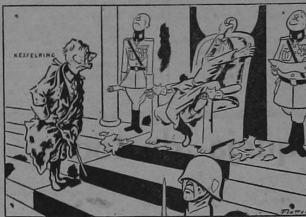
Hitler: "Dí a tus soldados que han de mantenerse en sus posiciones a toda costa... De la misma manera que lo está haciendo su Fuehrer!"